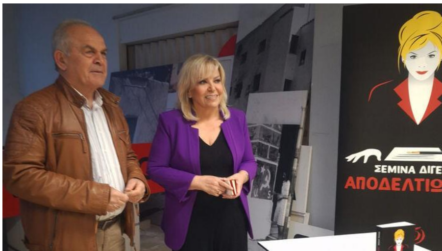
Με τον Κομμουνιστή Δήμαρχο Ηλία Σαφέλο

(...) Μια τέτοια μέρα, είμαστε εδώ για να πούμε δυνατά πως δεν παζαρεύουμε το δικαίωμα της νέας και του νέου στις δημόσιες και δωρεάν σπουδές, για πτυχία με αξία και όχι με βάση την τσέπη των γονιών τους. Υψώνουμε τη φωνή μας μαζί με το φοιτητικό και μαθητικό κίνημα ενάντια στα ιδιωτικά πανεπιστήμια, στην ευρωπαϊκή κανονικότητα της εμπορευματοποίησης της μόρφωσης των παιδιών μας.